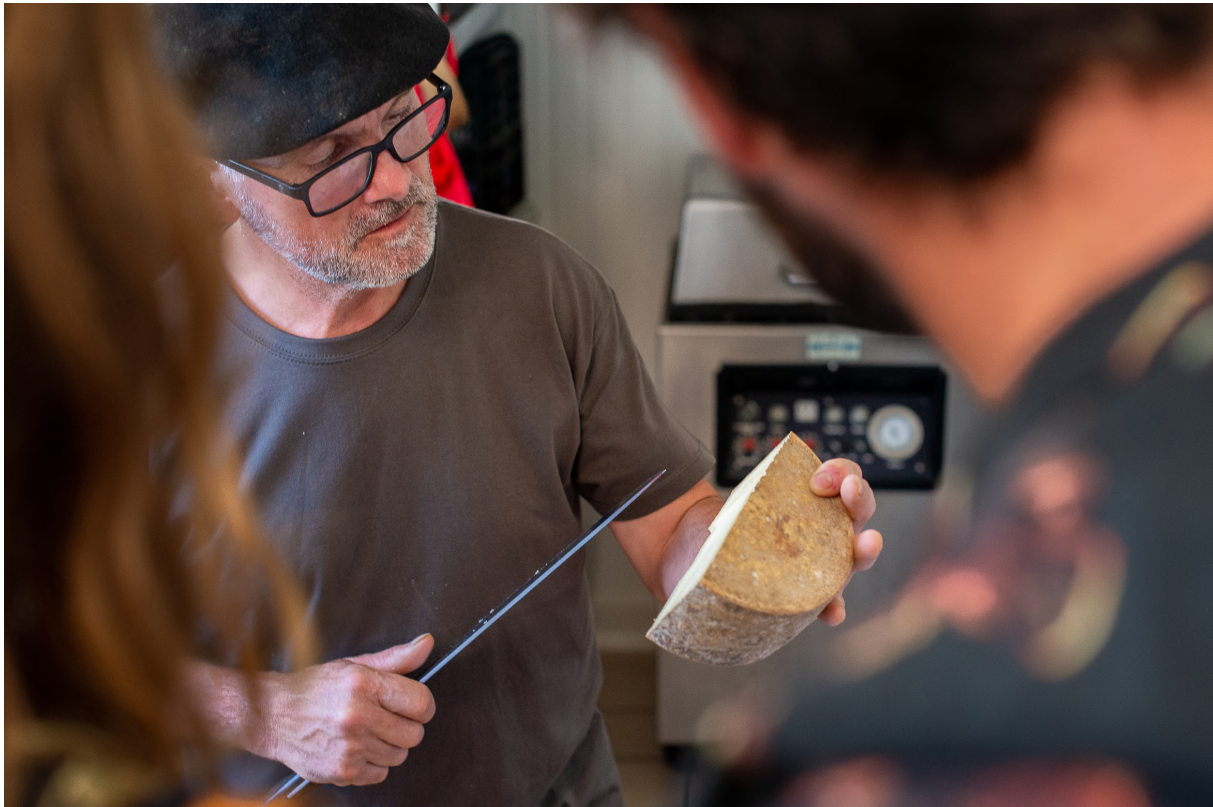
Ferme Xedaria Ayherre - Vacances en eusko

« Vacances en eusko » propose un parcours 100% connecté, réalisable en préparation des vacances à la maison, ou même dans le train, depuis son smartphone :